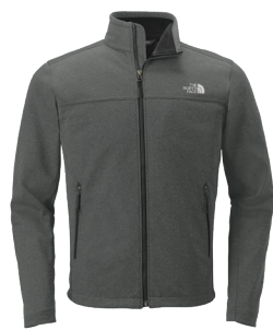
GRIS FONCÉ CHINÉ Cool Grey 11C & Cool Grey 8C

Vue la nature des polyester, des précautions particulières doivent être prises tout au long du procédé de décoration.