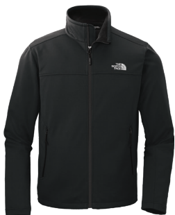
NOIR Black C

Les couleurs des tissus textiles sont sujettes aux variations du lot de teinture et ne correspondront pas exactement à la référence Pantone imprimée.